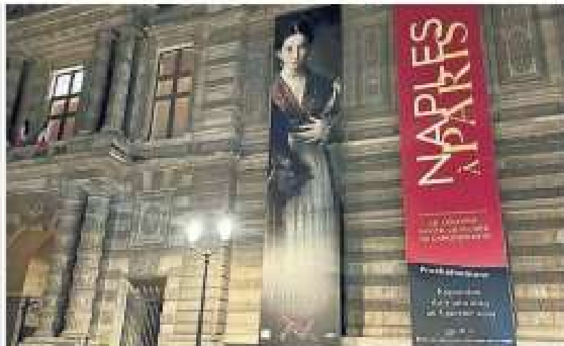
Museo. I Louvre, da domani, mostra a Parigi sessanta capolavori di Capodimonte